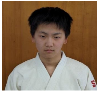
初段 志貴野中学校